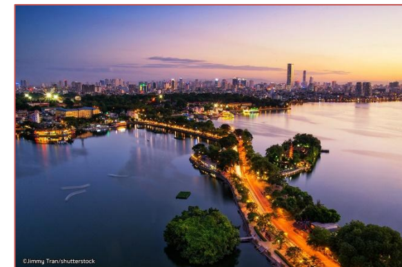
Panorama Hanoi, Vietnam