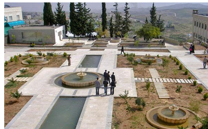
Al-Quds University, Gerusalemme

Credit system: Il sistema di crediti dell'università partner differisce dal sistema ECTS. L'Al-Quds propone questa tabella di conversione per cui 1 credito ECTS corrisponde a 0,5 crediti all'Al-Quds.