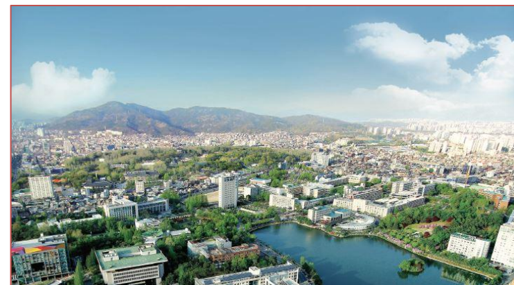
Konkuk University, Seoul

L'offerta dei corsi è però da ritenere solo orientativa, e deve essere confermata dell'università partner prima dell'inizio di ogni semestre.