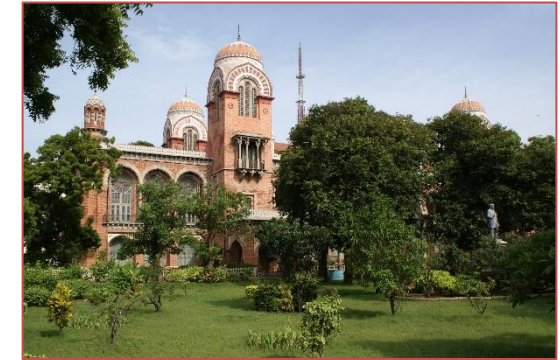
Il campus dell'Indian Institute of Technology

Link Utili Per ulteriori informazioni consultare: http://www.oir.iitm.ac.in/ .