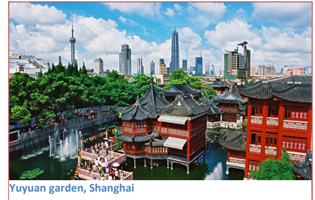
Yuyuan garden, Shanghai

Requisiti di ammissione. La Shanghai Normal University è specializzata in economia e business. I corsi sono strettamente legati a questo campo di studi e sono impartiti sia da docenti universitari che da esperti e uomini d'affari. L'università richiede un inglese fluente, i corsi dell'università sono a pagamento . Il costo varia da corso a corso, ma in generale un credito equivale a 700 CNY (ca. 95 euro). Se il soggiorno avviene nel primo semestre (settembre-dicembre), è possibile svolgere un periodo di stage presso imprese cinesi, italiane o internazionali dell'area di Shanghai. Tali stage si concludono di solito con l'offerta di un contratto di lavoro. L'Università offre anche corsi intensivi di lingua cinese, indispensabili oggi per chi intenda proporsi per uno stage.