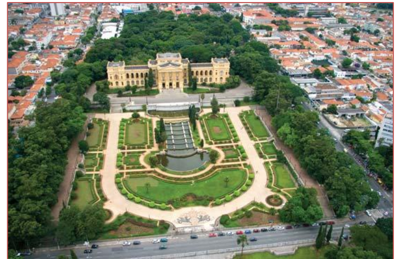
Universidade de São Paulo, São Paulo

Link Utili : http://www.usp.br/internationaloffice/en/index.php/campus-life/housing