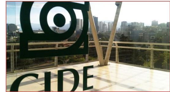
Vista dal campus di Santa Fe

Requisiti di ammissione. Certificato di lingua spagnola (B2). E' preferito il certificato dell'Istituto Cervantes. Altri certificati saranno comunque accettati, ma bisognerà all'arrivo sostenere un test obbligatorio di lingua. L'Università ospitante offre anche corsi di lingua Spagnola per aiutare gli studenti stranieri.