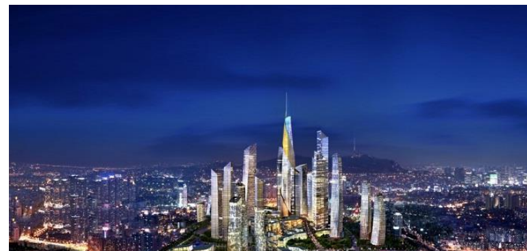
Panoramica di Seul