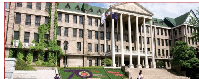
Il campus della Hanyang University

Link Utili: Informazioni per l'alloggio : http://www.hanyangexchange.com/preparations/accommodation/