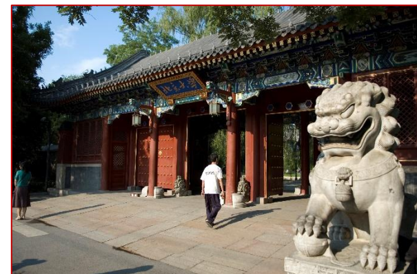
Entrata Ovest Peking University, Pechino

Requisiti di ammissione Il livello minimo per poter partecipare ai corsi in lingua Cinese è di HSK 6. Non vi è un prerequisito minimo per la lingua inglese, ma è preferibile che lo studente abbia un livello minimo pari al B2. L'ammissione definitiva ai corsi è comunque soggetta alla decisione dell'università ospitante in base alla conoscenza della lingua Inglese o Cinese.